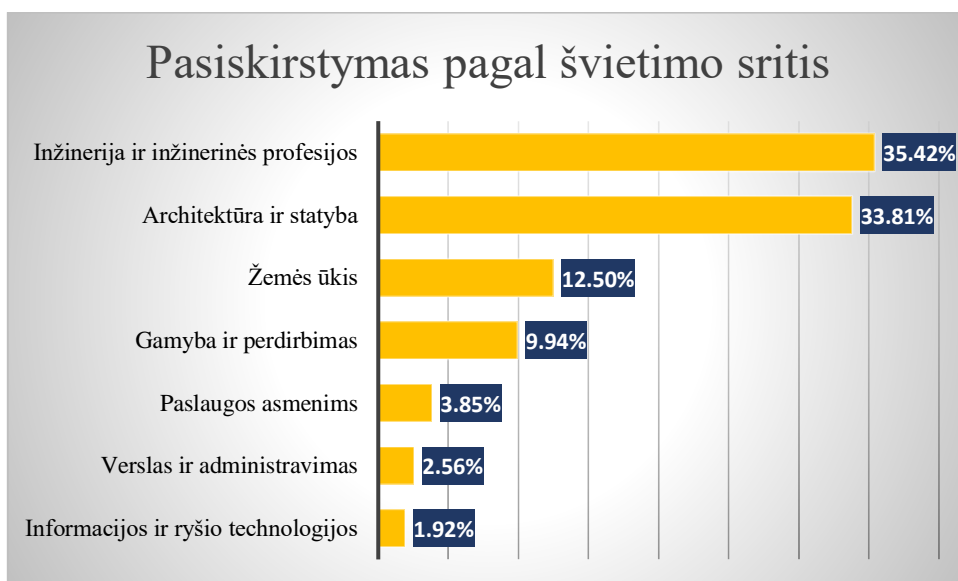
1 pav. Profesijų pasirinkimas pagal švietimo sritis

2018–2022 m. daugiausiai mokinių mokėsi pagal inžinerija ir inžinerinės profesijos švietimo srities bei architektūra ir statyba profesinio mokymo programas, stabilus išliko žemės ūkio srities profesinio mokymo programą besirenkančių mokinių skaičius.